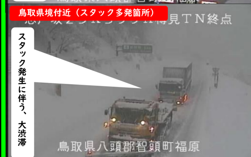
鳥取県境付近 (スタック多発箇所) 見TN終点