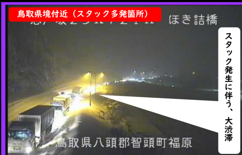
鳥取県境付近 (スタック多発箇所) ほき詰橋