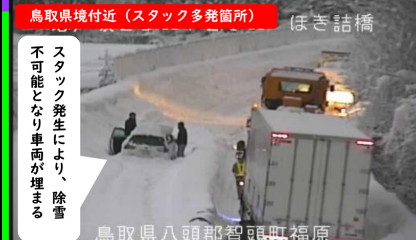
鳥取県境付近 (スタック多発箇所) ほき詰橋