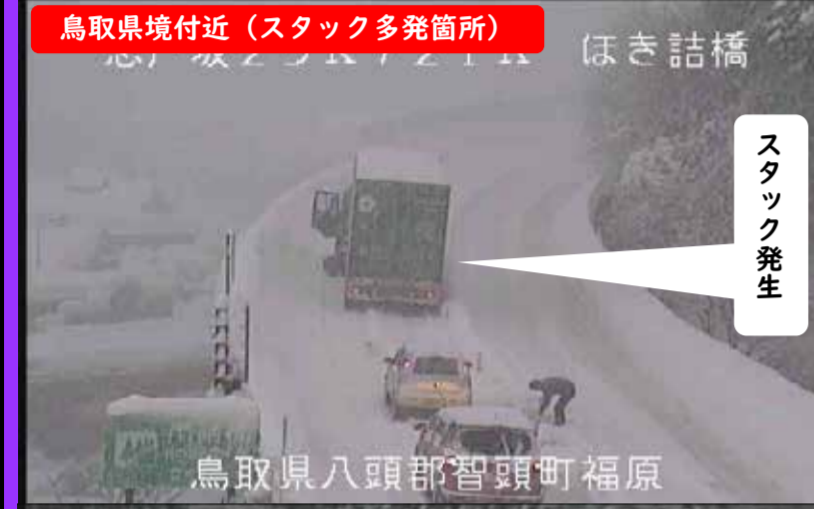
鳥取県境付近 (スタック多発箇所) ほき詰橋